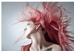
ve vlasech (vlasy)