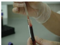
v krvi (krev)