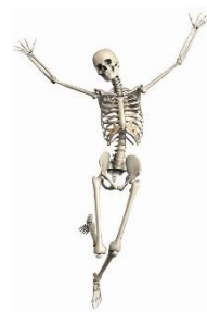
v kostech (kosti)

_____ se vyskytuje _____ _____ se vyskytuje _____ _____ se vyskytuje _____