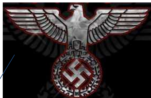
Říšská orlice a hákový kříž