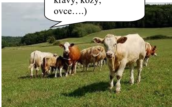
Pastevectví (chovali krávy, kozy, ovce....)