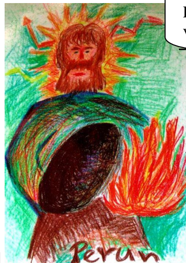
Mnohobožství – více bohů PERUN – bůh hromu a války