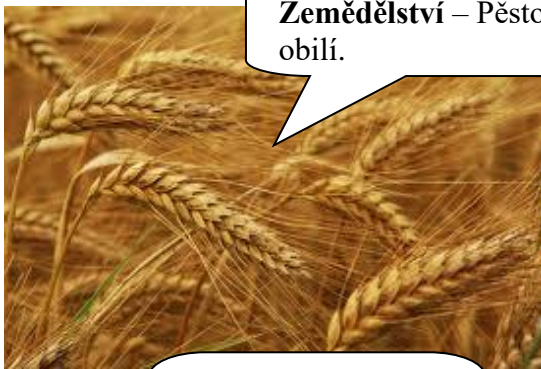
Zemědělství – Pěstovali obilí.