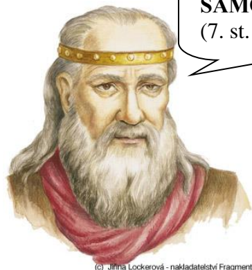
První vůdce Slovanů SÁMO – první říše (7. st. n. l.)

(c) Jiřina Lockerová - nakladatelství Fragment