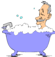
6.ON SE _____