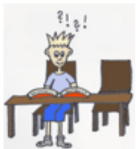
9.ON SE _____