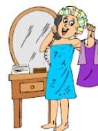
11.ONA SE _____