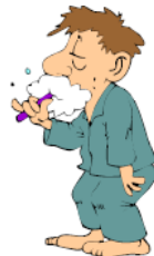
10. ON SI _____