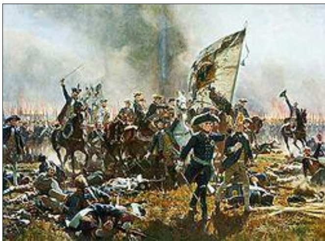
1) bitva slezské války