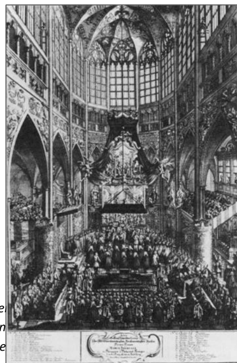
6) Korunovace 1743

Dostupné z portálu www.inkluzivniskola.cz , vytvořeného občanským sdružením Ministerstva školství, mládeže a tělovýchovy ČR. Provoz portálu je spolufinancován z fondu pro integraci státních příslušníků třetích zemí.