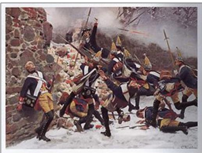
3) Pruská armáda