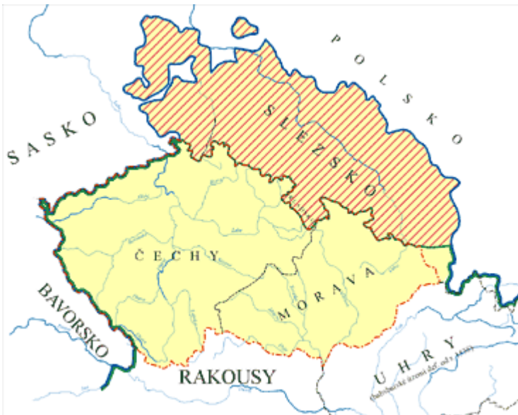
8) Mapa České země - ztráta Slezska