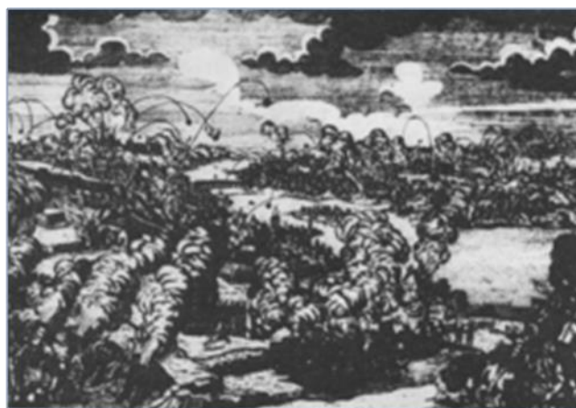
4) dobývání Prahy Prusy 1757