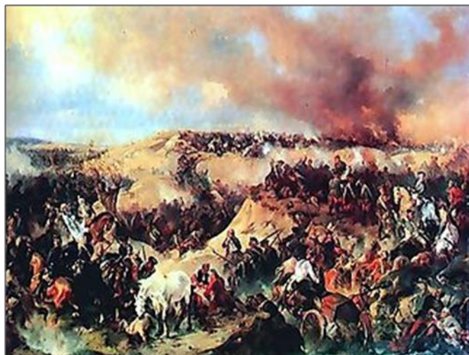
2) sedmiletá válka