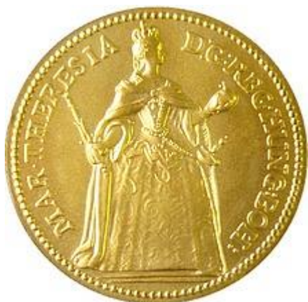
5) Pražský dukát – korunovace Marie Terezie 1743